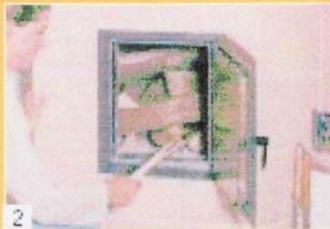
2 Bei wenig Holz die Scheite locker schichten, mit Papier, Spanholz oder Anzündhilfe im unteren Drittel anzünden.