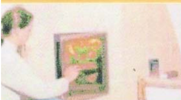
Nach dem Einheizen kann die Fülltüre geschlossen werden. Die Luftzufuhr bleibt geöffnet.