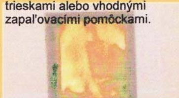
Der Verbrennungsvorgang dauert je nach Holzmenge 1/2 bis 1 1/2 Stunden.