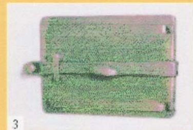
3 Wenn über dem Glutstock nur mehr kleine Flämmchen auftreten, kann abgesperrt werden - d.h. die Fülltüre ist zu schließen. Öffnen Sie die Fülltüre erst wieder nach 10- 12 Stunden.