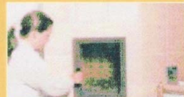
Wenn über dem Glutstock nur mehr kleine Flämmchen auftreten, kann abgesperrt werden - d.h. die Luftzufuhr ist zu schließen. Öffnen Sie die Fülltüre erst wieder nach 12 Stunden.