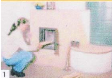
1 Holz im Brennraum kreuzweise aufschichten und die Luftzufuhr öffnen.