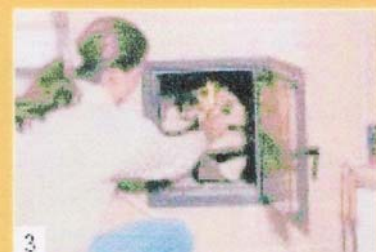
3 Bei viel Holz die Scheite dicht schichten und im oberen Drittel anzünden.