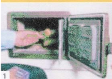
1 auch hier: Holz kreuzweise aufschichten.